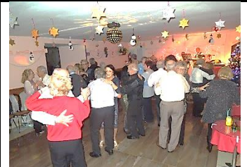
On danse !