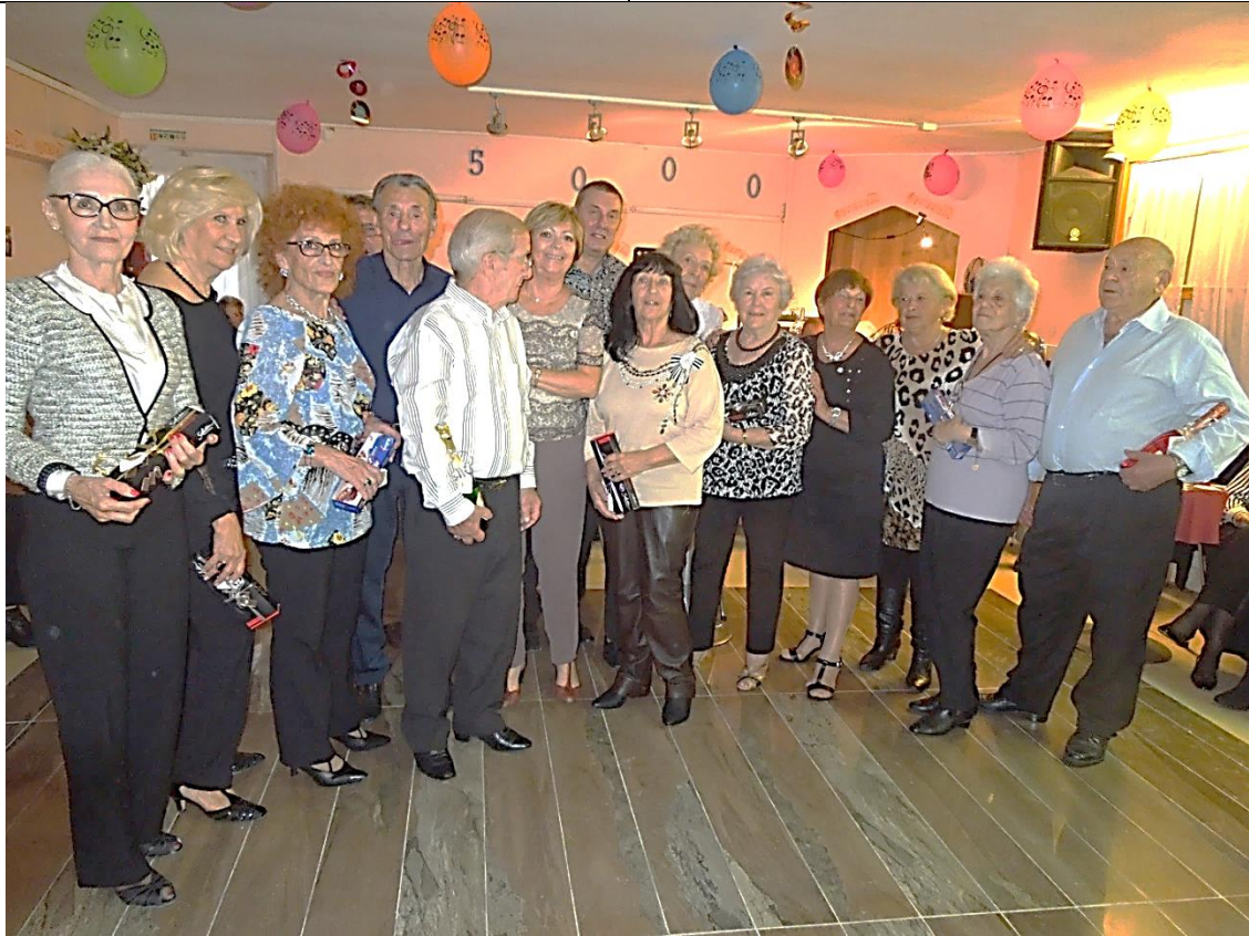
Radioux les natifs du mois d'Octobre !!!