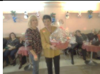
Le 1 er prix Babette