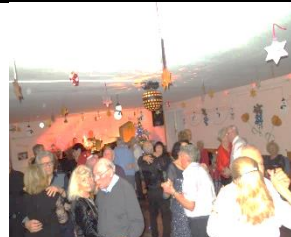
On danse !