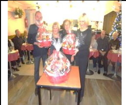
Les 2 gagnantes