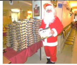
Le Père Noël